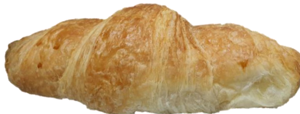
พบสีของแป้งไม่สม่ำเสมอซึ่งเกิดจากการติดกันของแป้ง แต่ไม่ขาด