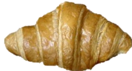
ลักษณะปกติ และจำนวนชั้นของครีวของต์ครบ 5-7 ชั้น