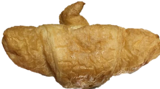
ลักษณะรูปทรงผิดปกติ

3.ลักษณะที่ ไม่สามารถยอมรับได้ (Rejected) (ต่อ)