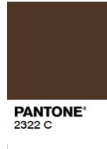
Reject (Too Dark)