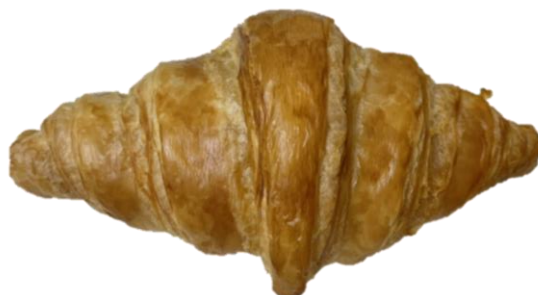
พบสินค้ารูปทรงแตกต่างกันแต่อยู่ในข้อกำหนด